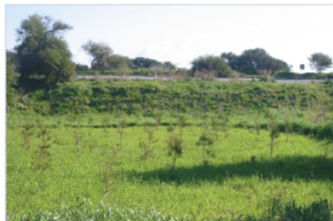
Whud mis-siġar indigeni li thawwlu fiż-żona ta taħt it-Torri l-Aħmar fil-limiti ta l-Aħrax tal-Mellieħa.

F'dan is-sit fil-passat, ukoll kien sar attentat biex jtkabbru s-siġar, bit-thawwil tas-siġar ta' l-Acacia, li sfortunatament kellhom impatt negattiv fuq il-biodiversità tal-post.