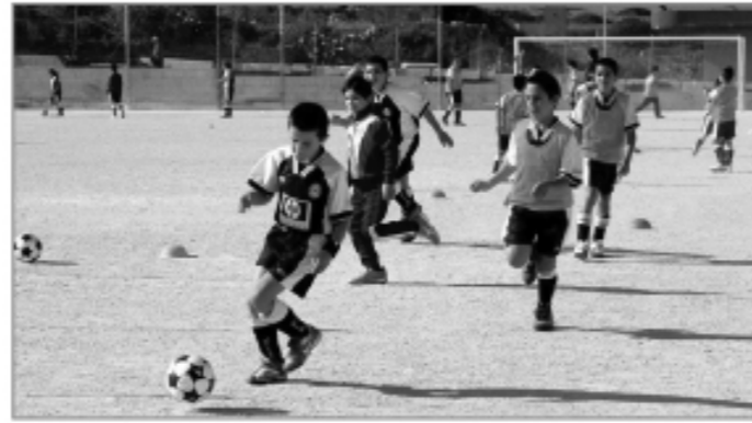
Uhud mill-250 tifel u tifla li se jgawdu minn dan il-proġett.