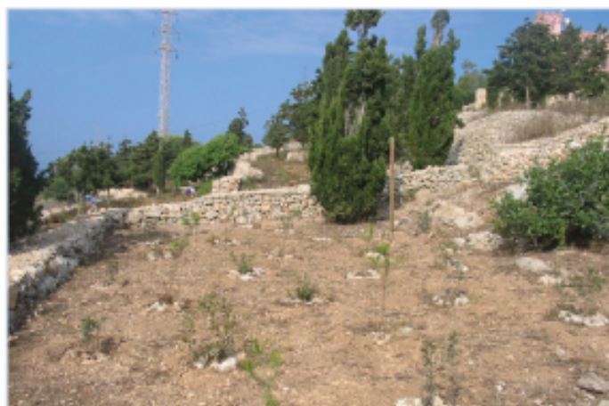
Il-proġett jinkludi wkoll il-bini ta' hitan tas-sejjeħ.