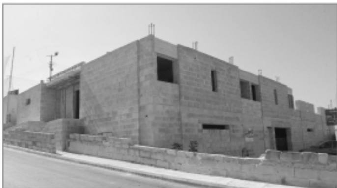
Il-bini tal-Kumpless Sportiv li issa wasal fi stadju avanzat